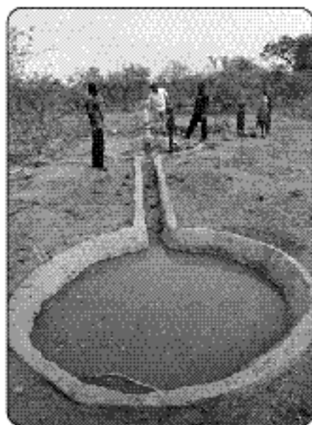
Nouveau forage avec réservoir pour les éviter d'abandonner pour les animaux.

Toutes ces actions ont été possibles grâce à la campagne de financement. Un travail immense a été effectué et ce, dans des conditions souvent très difficiles, compte tenu de la grande vulnérabilité des populations et de l'instabilité géopolitique qui prévaut. Cependant, les besoins sont immenses. Les efforts doivent se poursuivre.