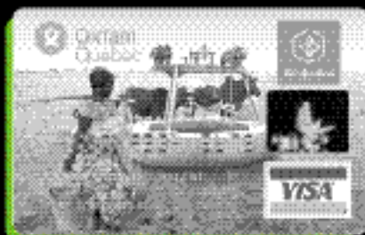
La carte VISA Desjardins Classique d'Oxfam-Québec

financiers des caisses Desjardins, divers articles de prestige et des billets de spectacles, sans compter une couverture d'assurances des plus généreuses.