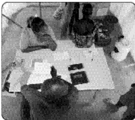
Centre de santé : consultation.

L'argent amassé a servi, au cours de la dernière année, à la construction de puits, à l'ouverture d'un centre de santé et à l'implantation d'un centre nutritionnel. De plus, nous avons formé du personnel local en santé humaine et animale. Des dispositions ont été prises afin de réagir à tout problème nutritionnel en situation d'urgence.