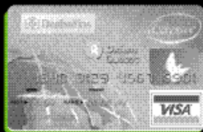
Carte VISA OR Odyssée Desjardins d'Oxfam-Québec