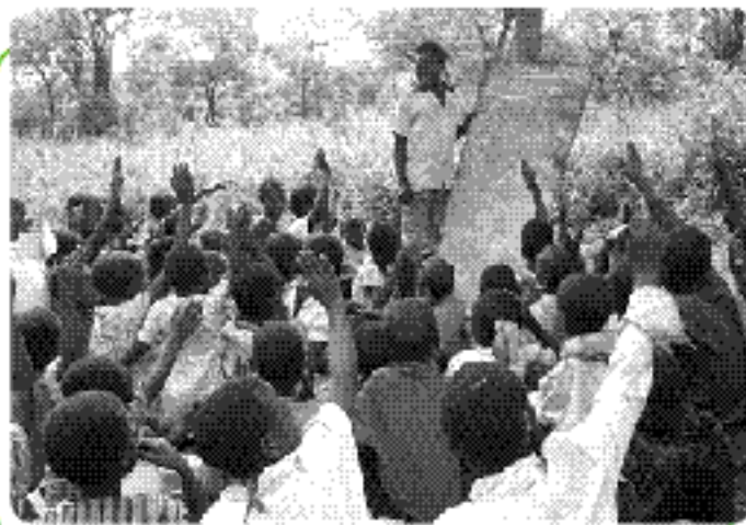
École primaire de Mpuzura, de la région de Kabale, Ouganda.

Chaque année, près de 12 millions d'enfants de moins de cinq ans meurent de causes directement reliées à des maladies infectieuses