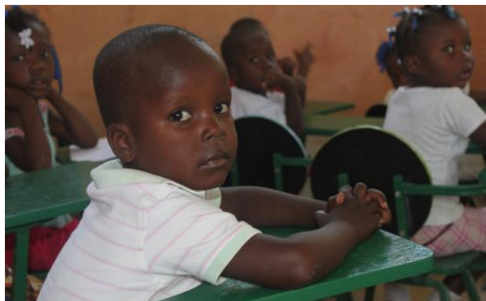
Les enfants du CHRIFED en bonne condition pour se former

« Peu de temps avant que j'ai reçu votre support, les enfants mangeaient par terre. Aujourd'hui, je suis heureuse de les voir manger à table... C'est vraiment agréable et c'est grâce à vous ».