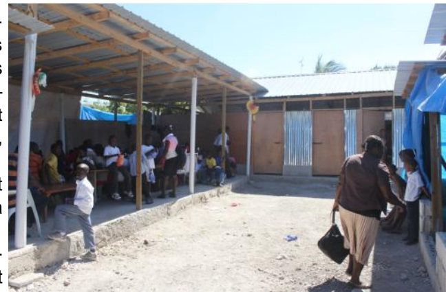
Des hangars construits par Oxfam-Québec pour le renforcement de CHRIFED

Madame Clunie explique que l'appui d'Oxfam-Québec a permis d'acheter des jouets pour les enfants, ce qui les aide à surmonter le traumatisme psychologique provoqué par le tremblement de terre.