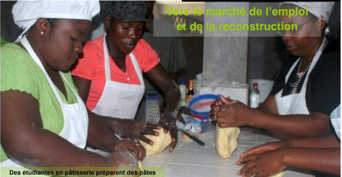
Des étudiantes en pâtisserie préparent des pâtes

Oxfam-Québec, par l'entremise de son Programme de Coopération volontaire (PCV), soutient la formation professionnelle des jeunes affectés de la région de Liancourt (Artibonite). Ce projet de renforcement de la formation professionnelle et d'insertion économique est exécuté par l'Association des parents et professeurs des élèves de Liancourt (APPEL).