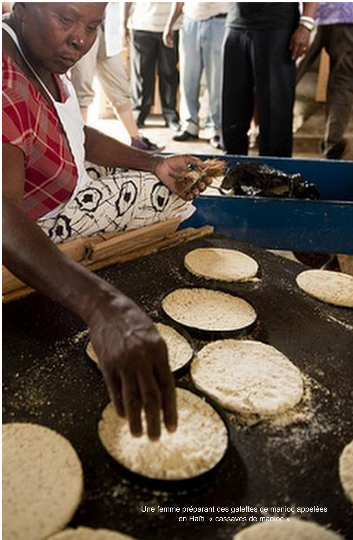
Une femme préparant des galettes de manioc appelées en Haïti « cassaves de manioc »