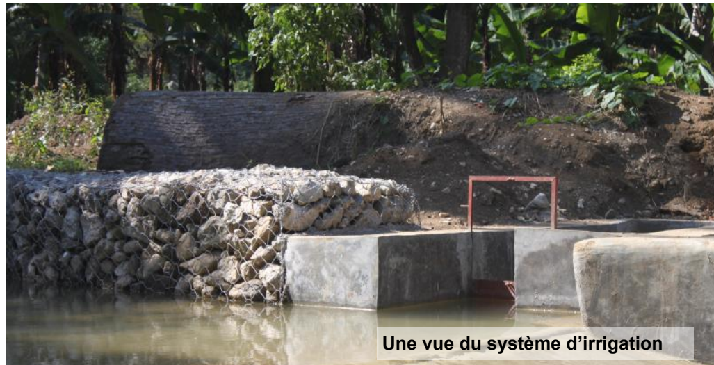
Une vue du système d'irrigation

truire la zone de Chalier détruite à maintes reprises par les inondations. Une boutique d'intrants, la construction de routes secondaires permettant la communication entre Chalier et les autres sections communales et accès à crédits agricoles font partie des principales revendications exprimées par ce comité au cours de cette cérémonie.