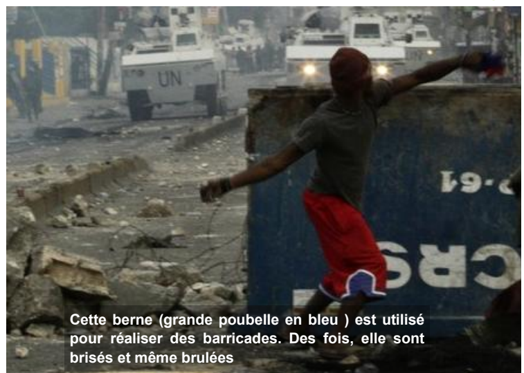
Cette berne (grande poubelle en bleu) est utilisée pour réaliser des barricades. Des fois, elle sont brisées et même brûlées