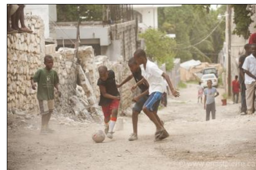
Des jeunes jouent au football, dans ce quartier de Delmas 60 très propre grâce à l'intervention des agents GDSM d'Oxfam-Québec

Oxfam-Québec travaille avec les autorités municipales tels que la DINEPA et le SMCRS sur le renforcement des capacités techniques, la mise en place de politique de gestion des déchets solides ménagers, la distribution de kits pour le ramassage d'ordures, la formation des groupes d'éboueurs et la mise en place d'une large campagne de sensibilisation avec l'appui d'une troupe populaire assurant la sensibilisation dans les lieux publics.