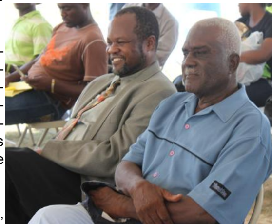
François Maurois (à droite) représentant du ministère de l'agriculture

La FAO estime qu'il est important que l'agriculture et la sécurité alimentaire soient remis à l'ordre du jour en cette journée mondiale de l'alimentation 2010 car le nombre de personnes souffrant de la faim cette année est estimée à 925 millions.