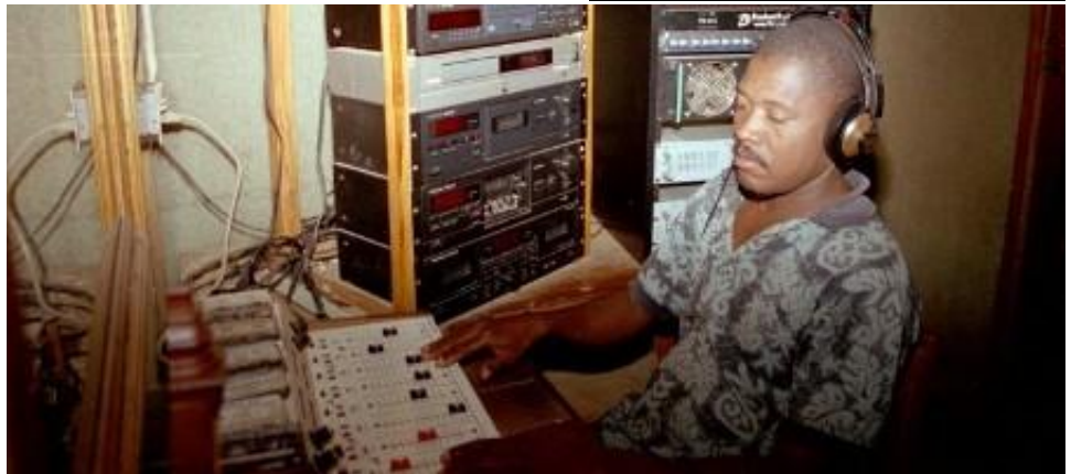
Les radios communautaires diffusent des messages de santé publique.

« L'objectif à l'heure actuelle est de minimiser les risques dans les camps où nous intervenons. Nous renforçons nos systèmes,