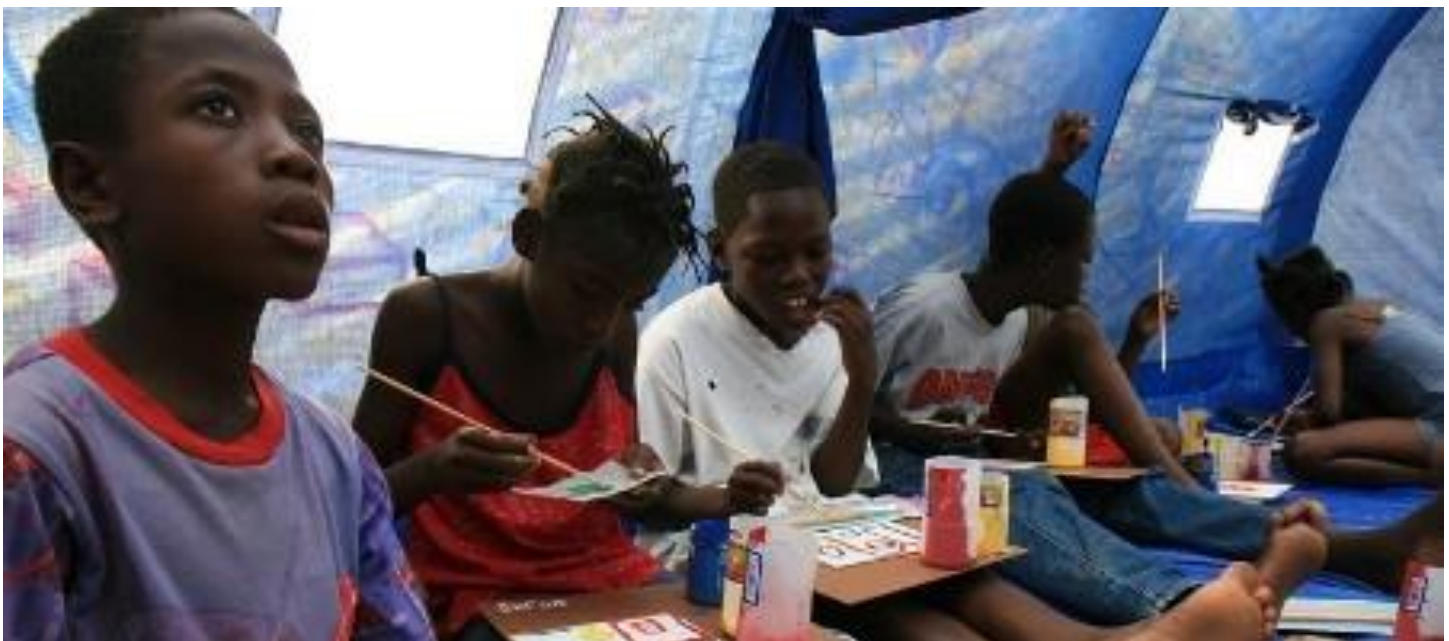
Projet de santé publique: des enfants réutilisent de vieux objets pour créer leur message de santé publique.

personnes et de continuer à coordonner nos activités avec le gouvernement et les organisations humanitaires.