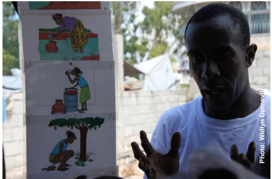
Un professeur enseigne les bonnes pratiques d'hygiène