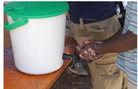
Mise en place de stations de lavage des mains

Pendant plus de dix mois, même avec plus d'un million de personnes vivant sous des tentes et des bâches, pas une seule irruption de maladie liée à l'eau n'a eu lieu à Port-au-Prince. Nous savons comment faire face à l'apparition de la maladie et le plus important maintenant est de diffuser les messages d'hygiène au plus grand nombre de