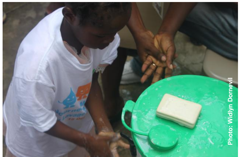
Une fillette se lave les mains avec de l'eau coulante et du savon