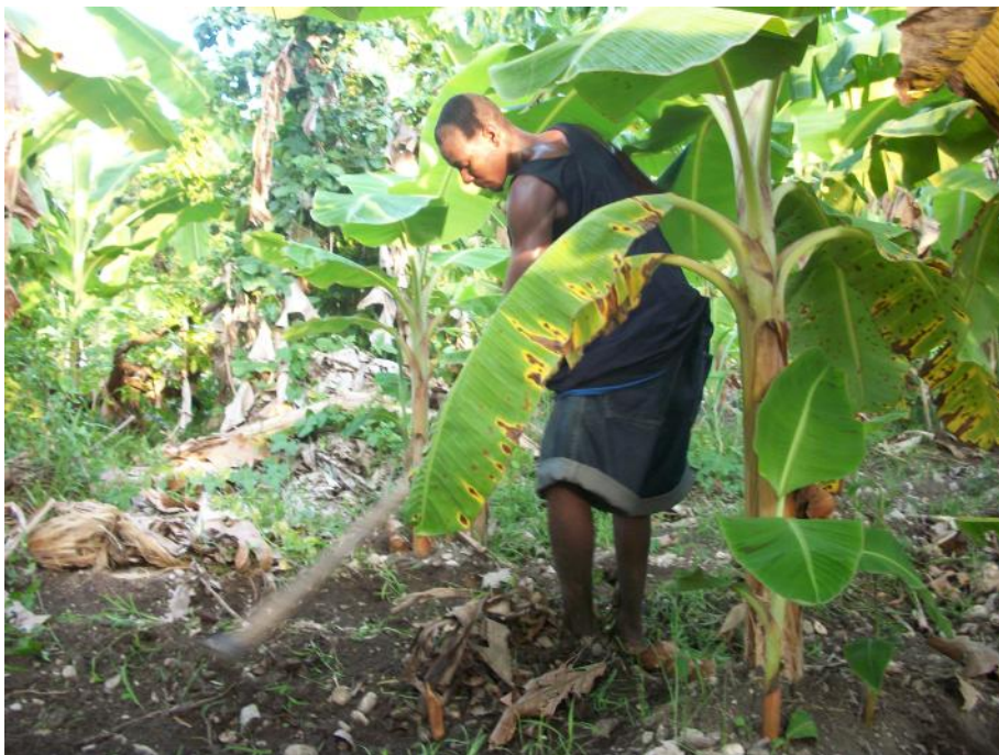
Un agriculteur à Marigot (Jacmel) prépare ses plantations de bananes. La production de bananes et d'autres tubercules a considérablement augmenté dans cette zone grâce au Projet d'appui à la relance de la production agricole nationale et à l'accroissement de la sécurité alimentaire (PARPANASA) d'Oxfam-Québec.