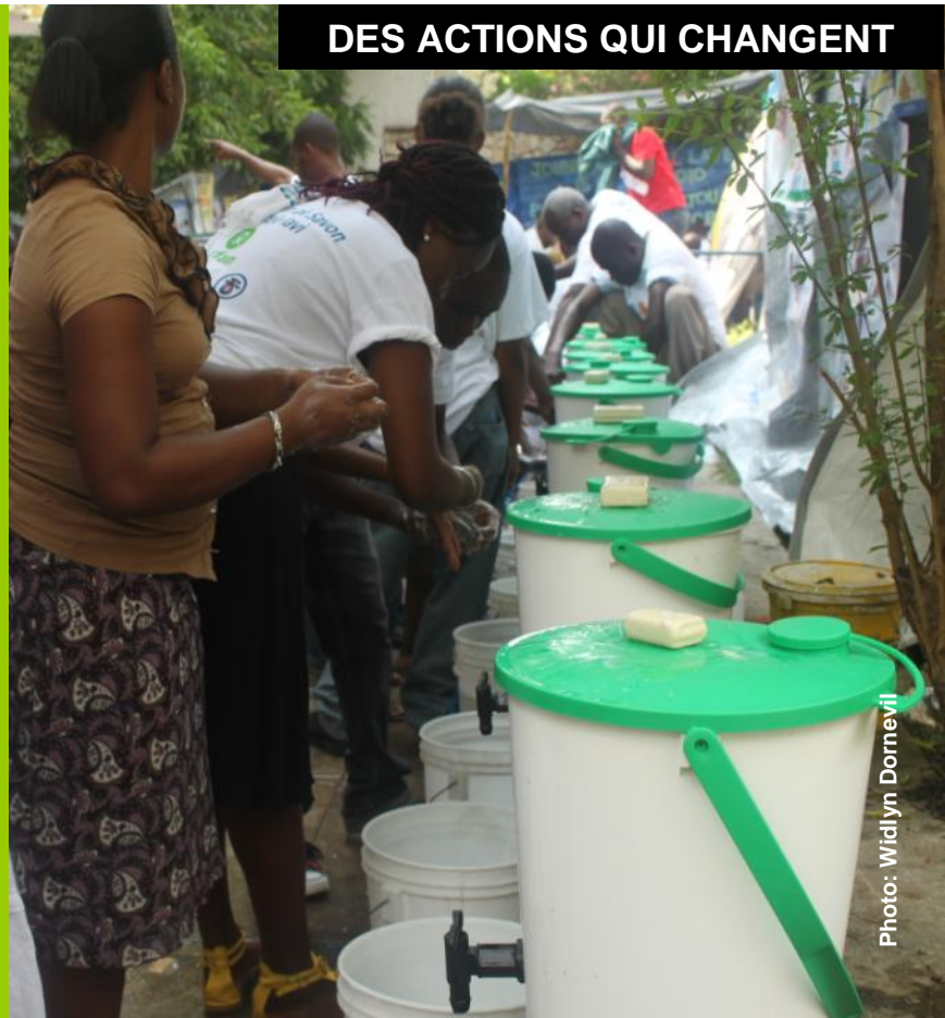
Station de lavage des mains

Nous sommes le vendredi 15 octobre, et plusieurs milliers d'enfants et d'adolescents se réunissent à Delmas 60, un grand site d'hébergement, « Bon dlo pwop ak savon se bagay nesese - en français; De l'eau propre et du savon, deux choses nécessaires » répètent-ils en se référant aux messages de sensibilisation produit par Oxfam-Québec et diffusé dans les camps au lendemain du séisme du 12 janvier.