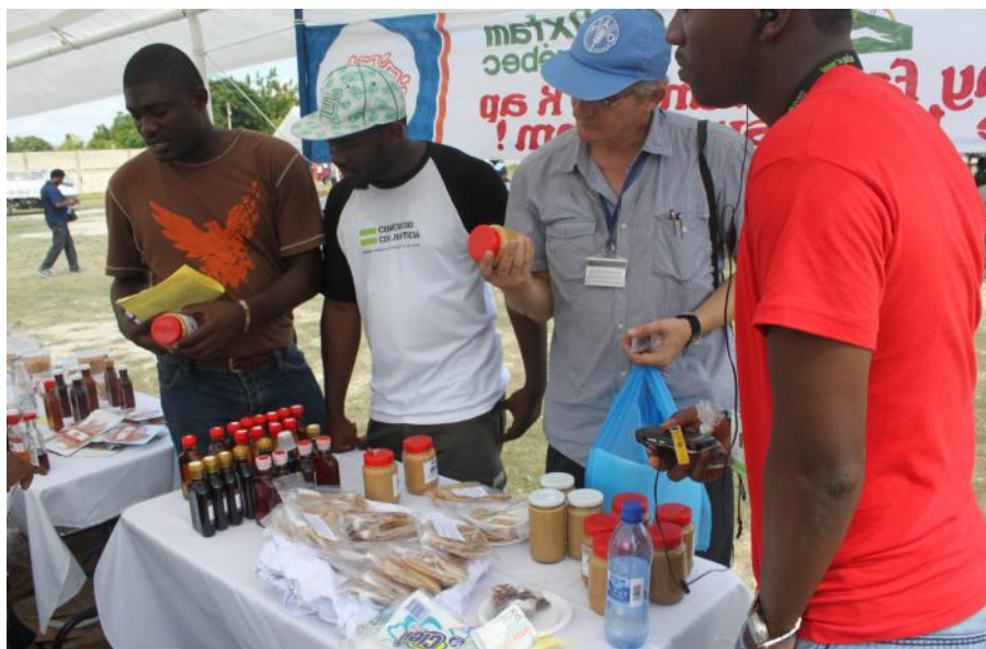
La foire a permis de mettre en valeur les produits locaux haïtiens

Les représentants d'Oxfam ont profité de l'occasion pour insister sur la nécessité de décentraliser le