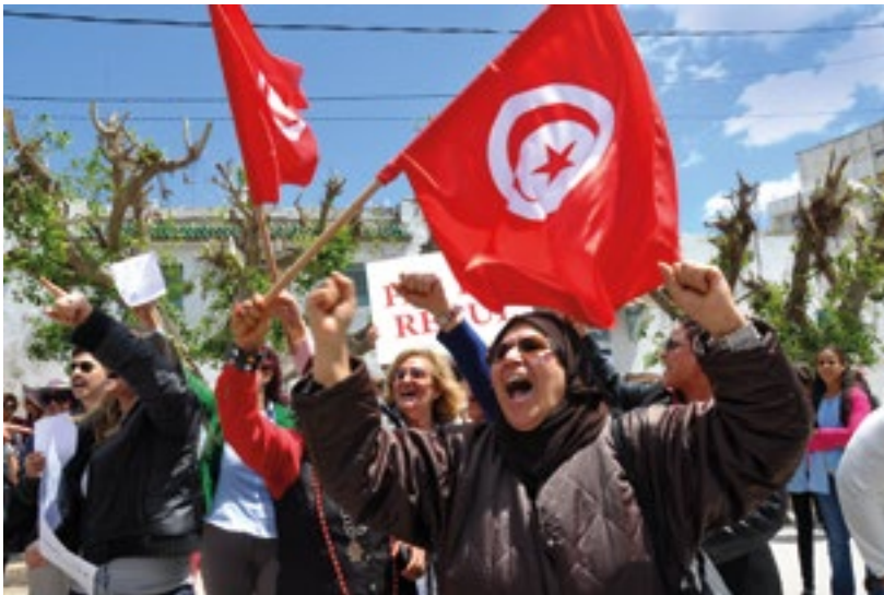
Des femmes manifestent devant l'Assemblée constituante tunisienne, et réclament la parité dans la loi électorale, Tunisie (2014).

À l'heure actuelle, les inégalités extrêmes nuisent à tous. Elles ne permettent pas aux personnes les plus pauvres dans la société, qu'elles vivent en Afrique sub-saharienne ou dans le pays le plus riche du monde, de sortir de la pauvreté extrême et de vivre dans la dignité.