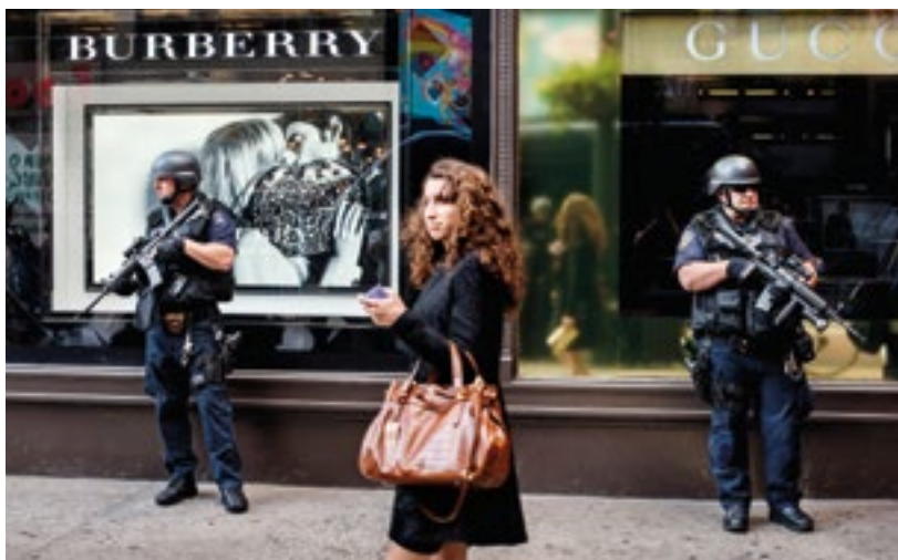
Une femme passe devant deux policiers lourdement armés gardant l'entrée d'un grand magasin à Manhattan (2008).

Des données probantes démontrent que, lors de tests, les personnes interrogées ont instinctivement l'impression que le bât blesse en cas de niveaux élevés d'inégalité.